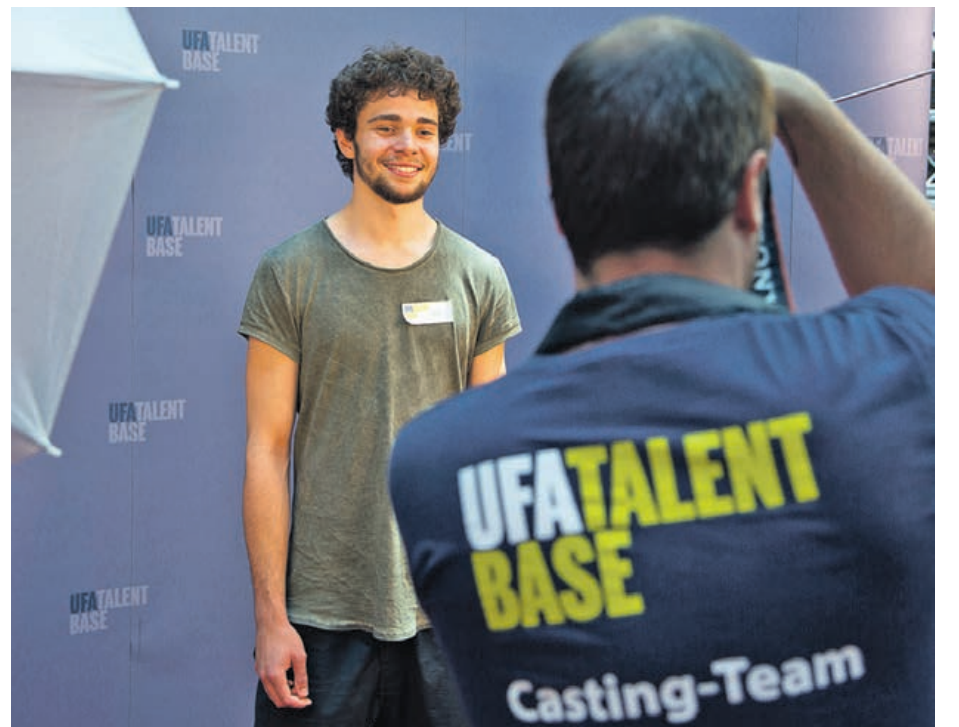
Bei der UFA-Talent Base kann man vielleicht den Grundstein für seine Karriere legen.